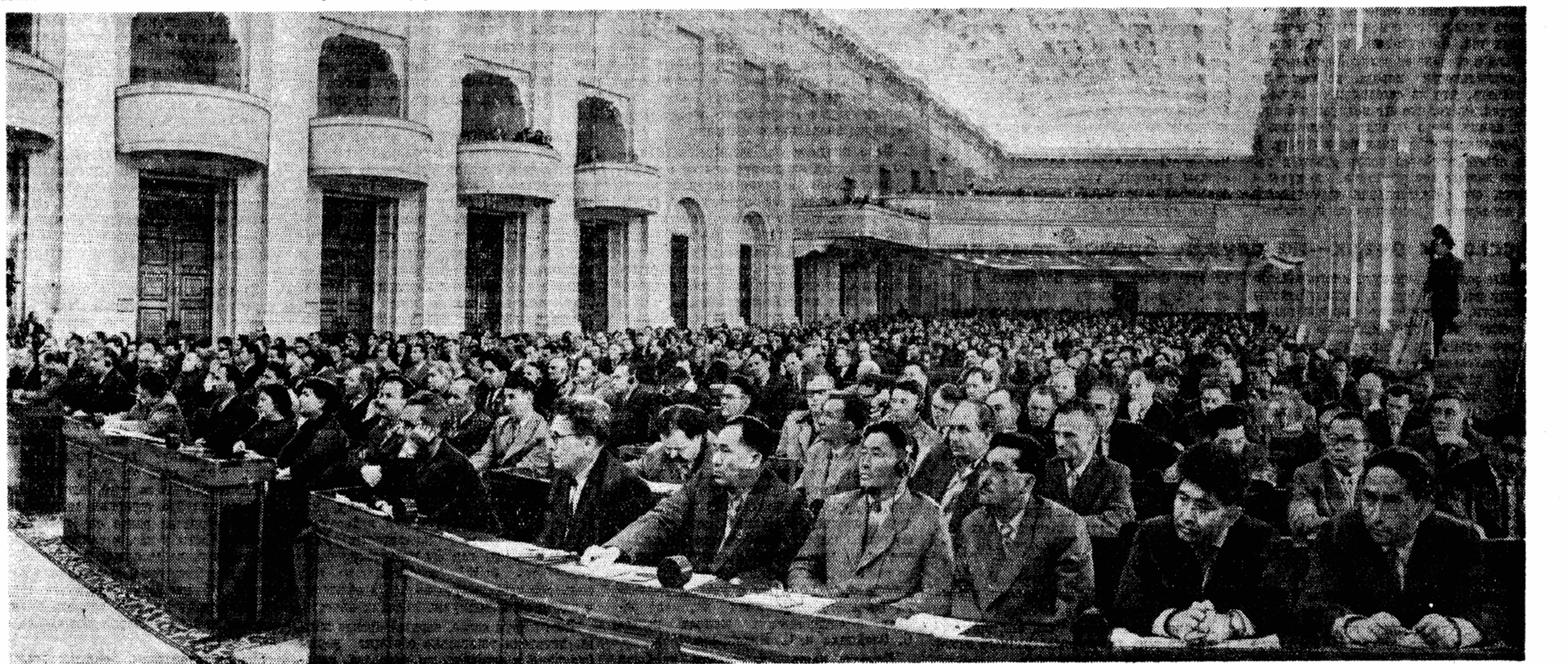
Зал заседаний Большого Кремлевского дворца. Третий съезд писателей СССР начал свою работу.